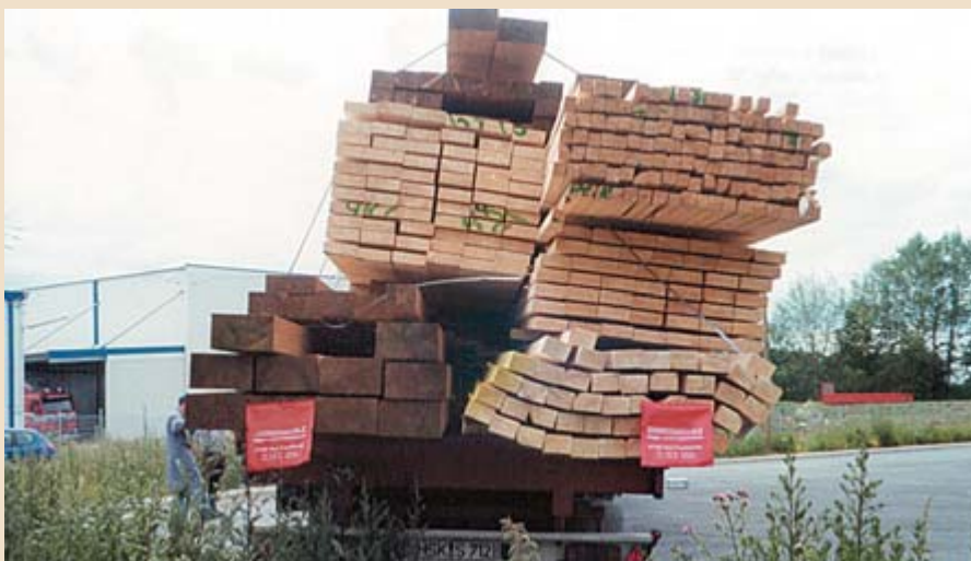
Die Ladung wurde beim Fahren so instabil, dass sie das Fahrzeug beinahe zum Umkippen gebracht hätte.

Bei der Beladung spielt natürlich auch die richtige Lastverteilung eine wichtige Rolle. Eine formschlüssige Ladungssicherung und eine ausgeglichene Lastverteilung, diese beiden Punkte scheinen sich oft zu widersprechen. Das muss nicht sein, denn man kann beides in Einklang bringen.