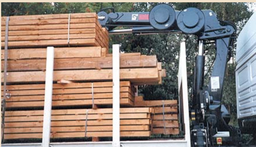
Wegen dieser Ladelücken kann die Ladung bei einer Vollbremsung nach vorn rutschen und die Stirnwand beschädigen.