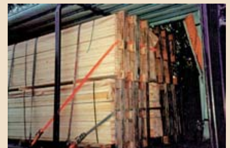
▲ Formschluss nach vorn durch Kopfschlingen.