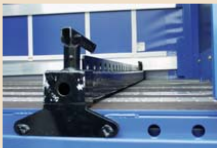
▲ Formschluss nach vorn durch einen Multiblock.