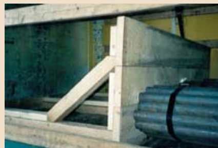
▲ Formschluss nach vorn durch eine Holzkonstruktion.