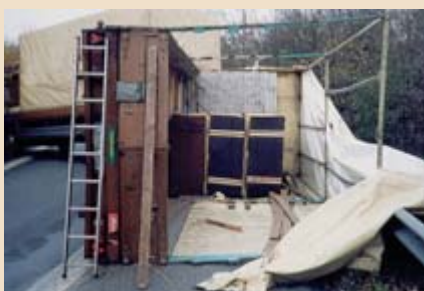
▲ Die Ladung war unter Missachtung der Lastverteilung direkt an die Stirnwand geladen.

Zuerst sollte die Ladung auf einem Fahrzeug längsmittig geladen werden. In Fahrtrichtung gesehen sollte der Schwerpunkt auf einer gedachten Linie liegen, die von der Mitte der Stirnwand zur Mitte der Rückwand verläuft (rote Linie).