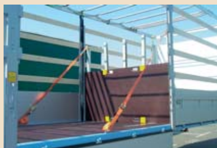
▲ Einsteckungen mit einer Zwischenstirnwand.