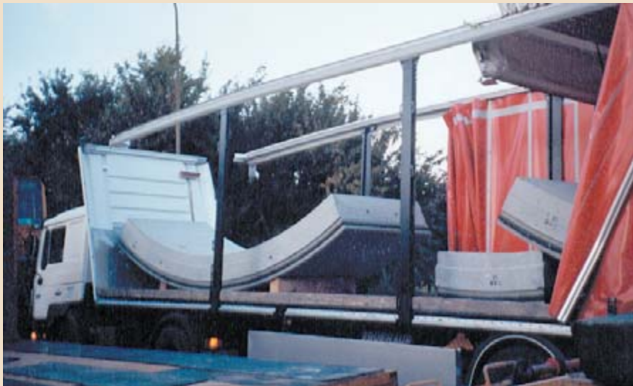
◀ Und es bewegt sich doch: Das schwere Betonteil hat die Stirnwand nach vorne gedrückt.