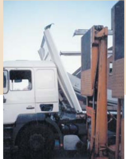
Der Schaden am Lkw ist beträchtlich. ▼