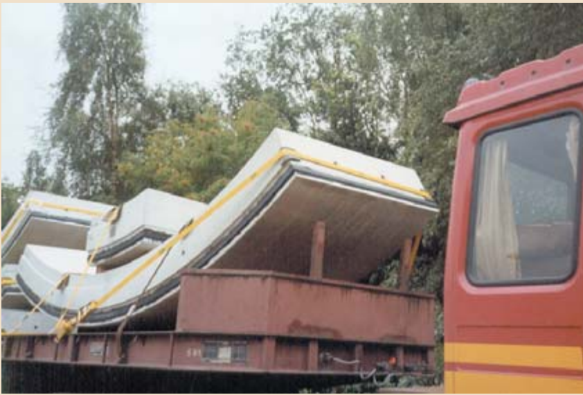
▲ Mit einer kombinierten Ladungssicherung – wie auf diesem Foto – hätte der Unfall vermieden werden können.