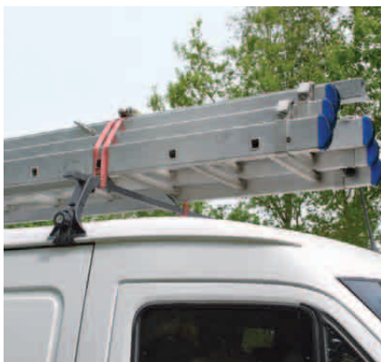
Einteilige Zurrgurte eignen sich gut zur Sicherung von Dachlasten.

Der einteilige Zurrgurt besteht aus einem langen Gurtband und einer Ratsche oder einer Gurtbandklemme, er hat keine Zurrhaken. Diese spezielle Gurtart wird häufig zum Bündeln oder Umreifen von Ladungsteilen genutzt.