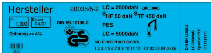
Beispiel eines Zurrgurttickettes gemäß der DIN EN 12195-2

Zurrgurte müssen mit einem rechteckigen, dauerhaft beständigen Etikett versehen sein. Bei zwei- oder mehrteiligen Zurrgurten müssen sowohl das Festende als auch das Losende gekennzeichnet werden.