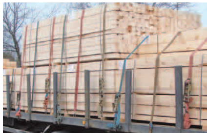
Zweiteilige Zurrgurte werden hauptsächlich zum Niederzurren eingesetzt.