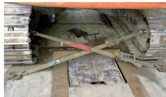
Verwendung von Schwerlastgurten zum Diagonalzurren.

Die DIN EN 12195-2 fordert, dass die Vorspannkraft einer Ratsche ( S_{TF} ) mindestens 10% der zulässigen Zugkraft (LC) betragen muss. Bei Schwerlastgurten wird dieser Wert von den Ratschen in der Regel nicht erreicht. Aus diesem Grund ist dann auch kein S_{TF} -Wert auf dem Zurrgurttickett aufgedruckt und diese Schwerlastgurte dürfen nicht zum Niederzurren verwendet werden.