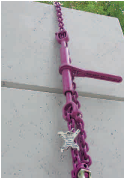
ICE-Zurrkette mit neuem Spann- und Verkürzungselement

lang das erste Mal der durchgängige Nenndickensprung gegenüber Güteklasse 8, auch bei dünneren Abmessungen mit einer Nenndicke von unter 16 mm.