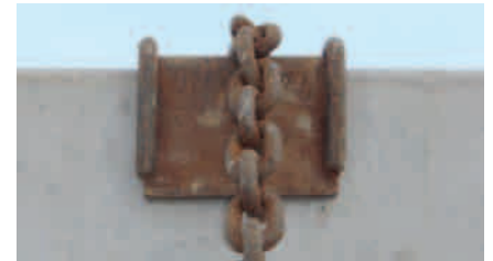
Der Kantenschützer aus Metall schont die Kette und die Ladung.

liegt laut Herstellerangaben im Bereich von 1.500 daN bis 4.200 daN im direkten Zug. Aber Achtung, die Ladung und vor allem die Zurrpunkte am Fahrzeug müssen diese Kraft auch aufnehmen können.