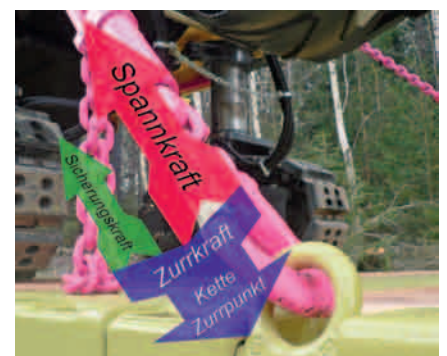
Die Spannung ist zu hoch, sie raubt der Kette und dem Zurrpunkt zu viel Kraft.

Beim Direktzurren soll die Kette die Ladung nicht ziehen, sondern sie soll sie an ihrem Platz halten, und zwar erst dann, wenn sie in Extremsituationen rutschen oder kippen will. Es ist sogar sehr nachteilig, wenn die Kette zu stramm vorgespannt wird, denn je mehr Kraft ich der Kette – und gleichzeitig auch dem Zurrpunkt – durch eine hohe Vorspannung nehme, desto weniger Kraft bleibt ihnen, um die Ladung dann zu halten, wenn es tatsächlich darauf ankommt. In der Praxis sollte die Kette handfest gespannt werden, das bedeutet, dass sie nicht mehr durchhängt aber auch noch keine „Musik macht“.