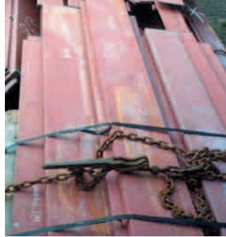
Diese Spannelemente sind gefährlich und dürfen nicht verwendet werden.

Beispiel: Die Kette hat eine Zurzkraft (LC) von 10 kn (10 t), der Zurzpunkt ist mit der Zahl 5 gekennzeichnet und kann daher ebenfalls mit 10 t belastet werden. Der Fahrer spannt die Kette so stark an, wie er kann und erreicht dabei eine Spannkraft von 6.000 daN (6 t). Jetzt bleibt dem System Kette – Zurzpunkt nur noch eine „restliche“ Sicherungskraft von 4 kn (4 t) für ihre ei-