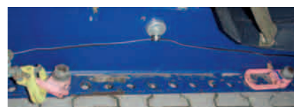
Dieser hoch belastbare Schwerlastzurrpunkt kann variabel positioniert werden.

Werden Zurrketten zum Niederzurren eingesetzt, kann man ihre hohe Vorspannkraft ( S_{TF} ) nutzen, denn diese