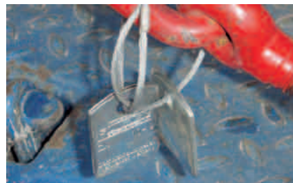
Zurrkette mit zwei Kennzeichnungsanhängern

Es empfiehlt sich, an der Zurrkette einen zweiten Kennzeichnungsanhänger anzubringen, auf dem die jährliche Prüfung vermerkt ist.